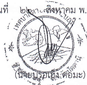
นายกเทศมนตรีตำบลเตราะบอน